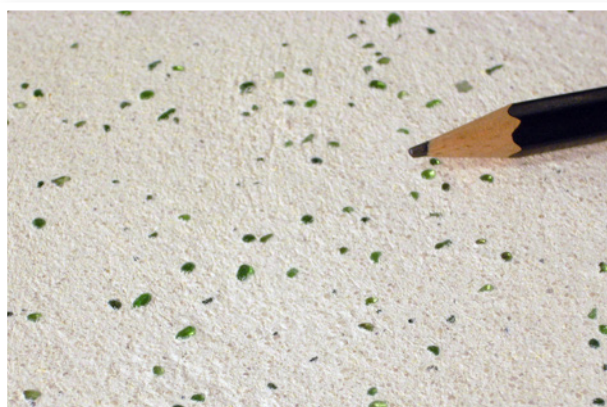
6% Mărgele de sticlă - verde deschis, în Tencuială pe bază de var Medie