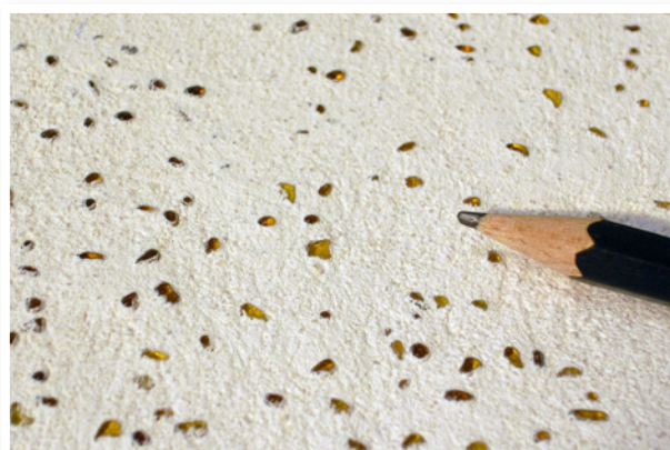
6% Mărgele de sticlă - chihlimbar, în Tencuială pe bază de var Medie