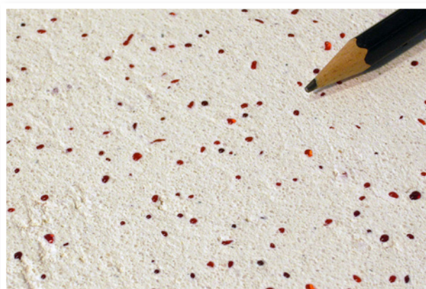
6% Mărgele de sticlă - rubin, în Tencuială pe bază de var Medie