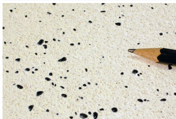
6% Mărgele de sticlă - negru, în Tencuială pe bază de var Medie