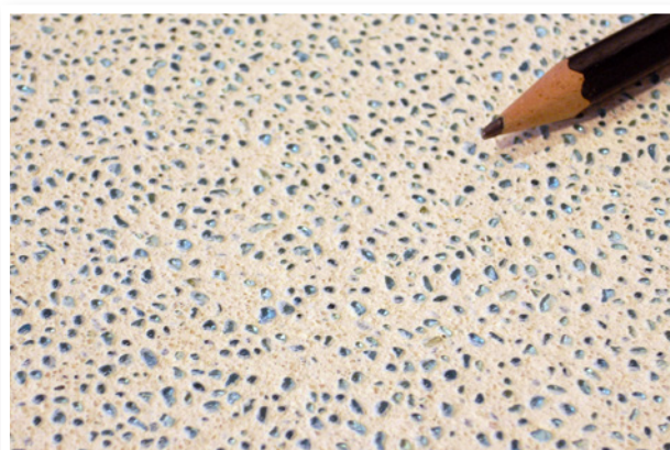
100% Mărgele de sticlă - turcoaz, în Tencuială pe bază de var Medie