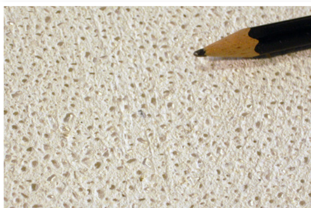
100% Mărgele de sticlă - transparent, în Tencuială pe bază de var Medie